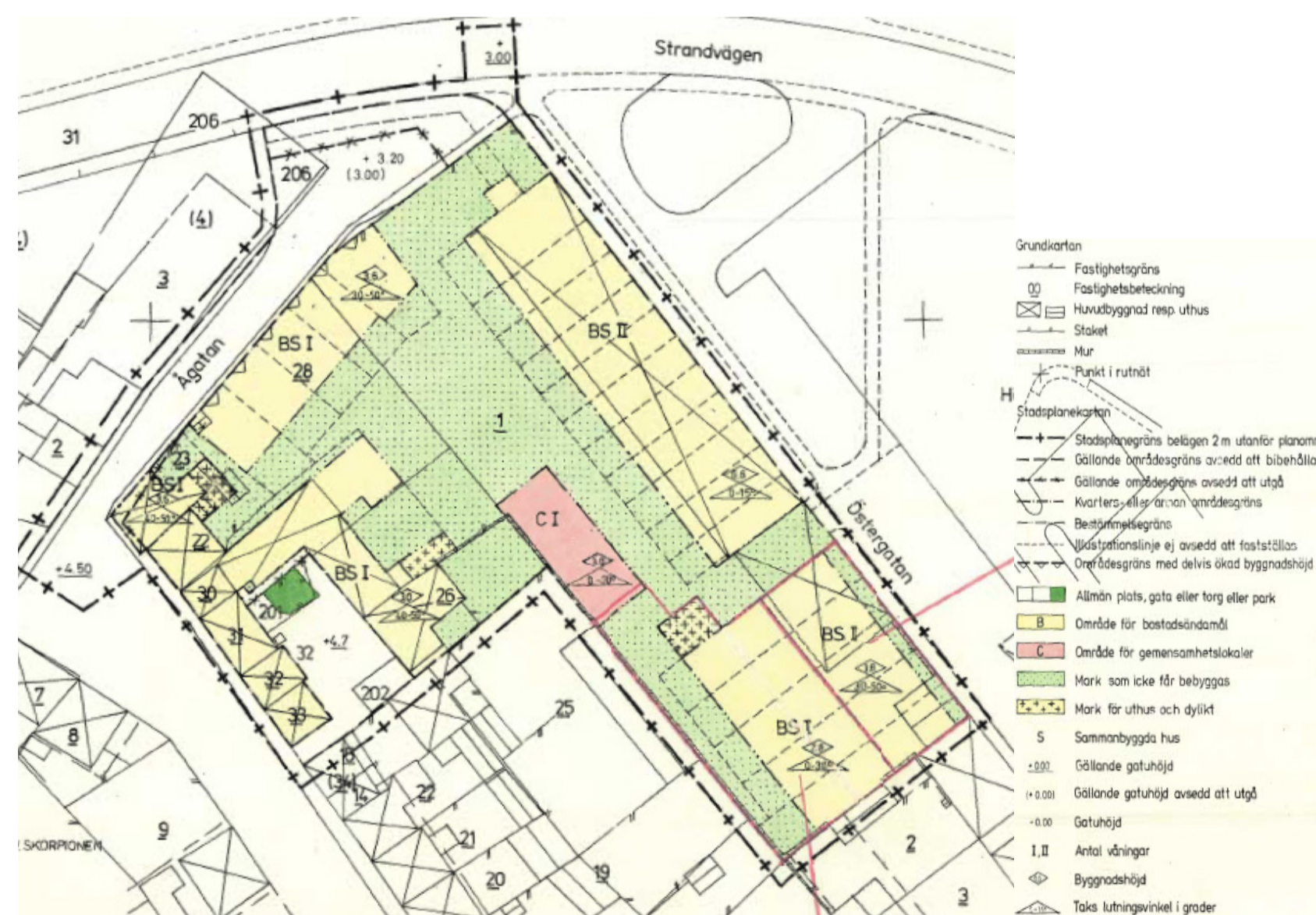
Utdrag ur Stadsplan för kv. Taltrasten i Simrishamn, fastställd 1977-03-14. Ej skalenlig.