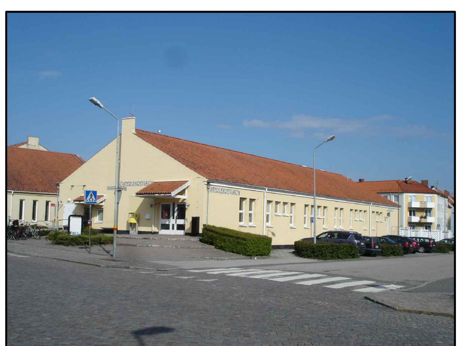
Bebyggelse Samskolan 2