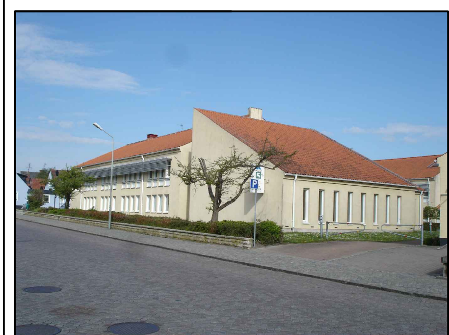
Bebyggelse Samskolan 1