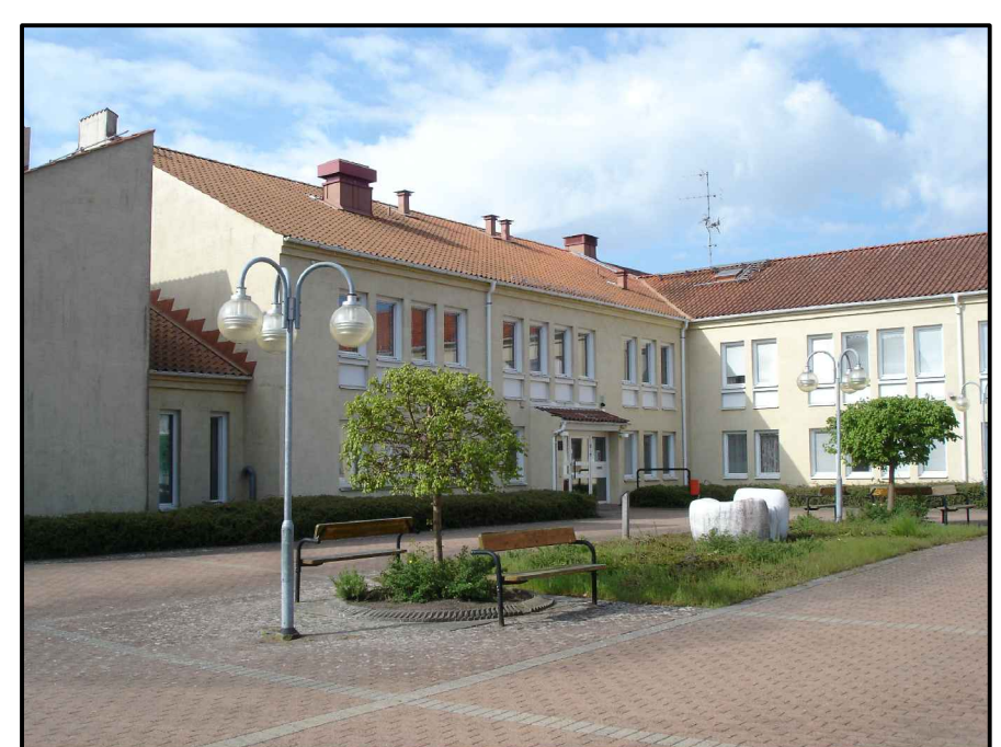
Innergård Samskolan 1