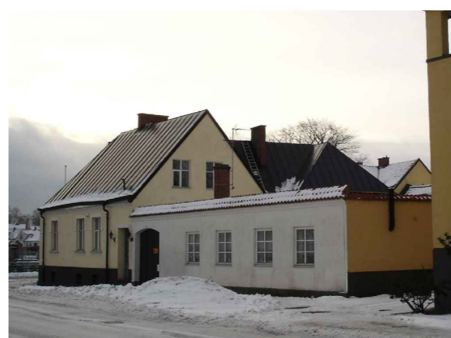
Foto: Fasad mot Strandvägen i nordöst. December 2010. Evelina Simonsson