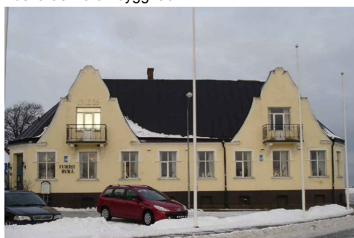
Foto: Fasad mot sydost. December 2010.

För det äldre uthuset mot Strandvägen, som enligt ritning från 1914 användes till tvättstuga och rökeri, är byggnadens fönstersättning och takutförandet detsamma som från 1914. Höjning av byggnadens tak möjliggörs med planbestämmelserna. Exteriör mot Strandvägen med slätputsad fasad i vit nyans, portik, profilerad takfot och fönster i trä med mittpost och spröjs ska bevaras vid ombyggnad.