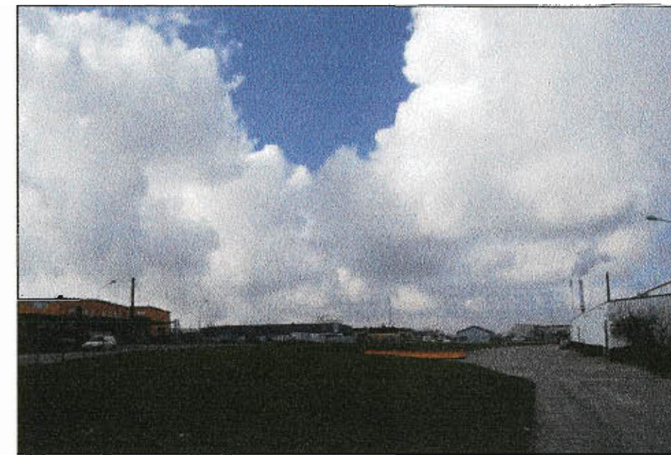
Gräsytan längs med Fabriksgatan