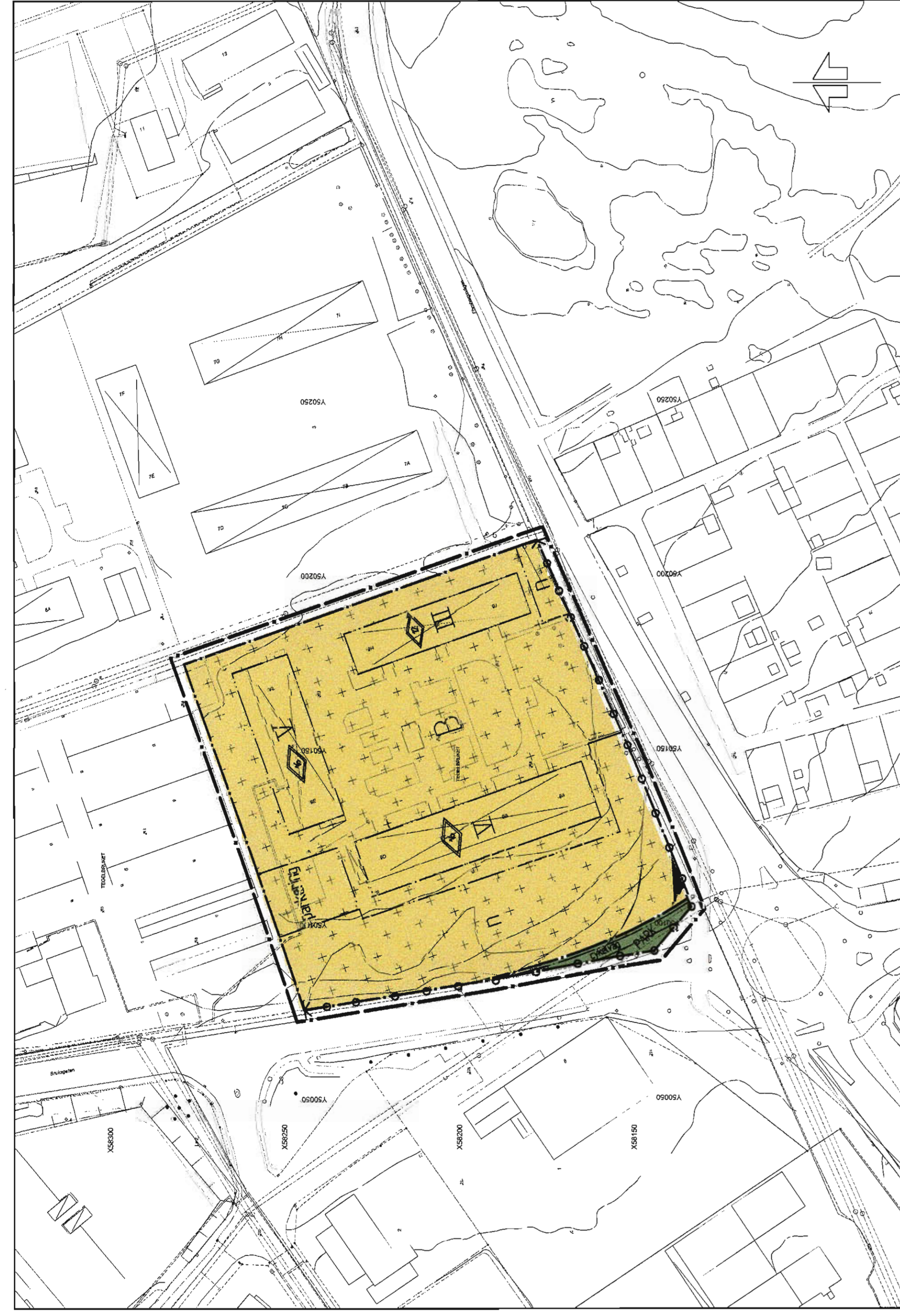
PLANKARTA skala 1:1000