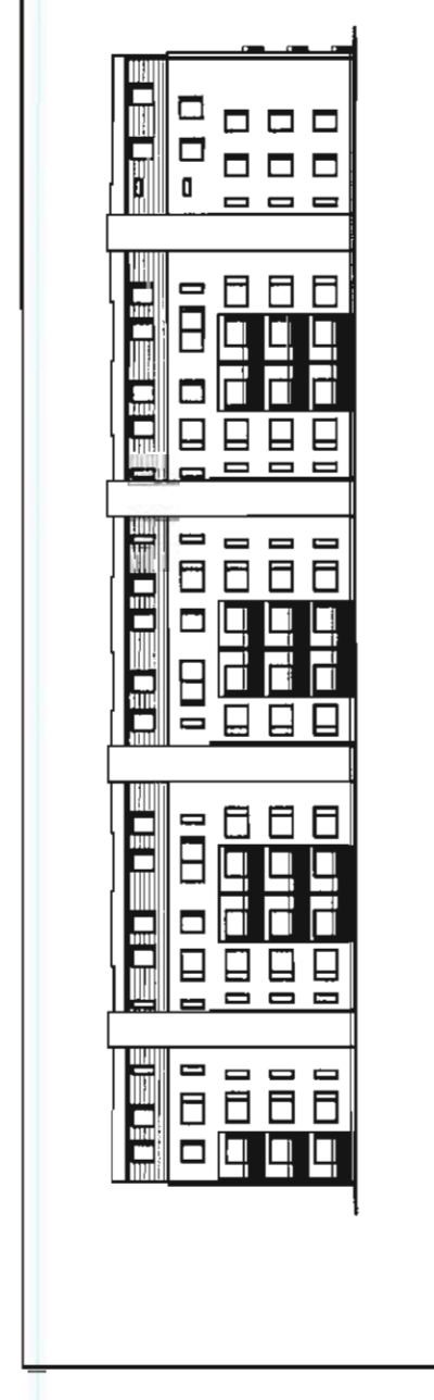
Exempel på ny fasad 9 A-D åt väster